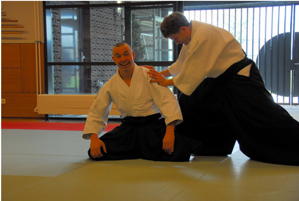
Lachende aikidoka

Wanneer je lacht ben je open. Wanneer je niet lacht, dan zijn er andere gevoelens in je geest. Je geest is dan vertroebeld waardoor er geen ruimte is voor mentale aikido. Ik kan mij trainingen van Bacas Sensei herinneren waarin ik zo moe werd dat ik op wou geven. Maar Bacas Sensei bleef zeggen dat je moest blijven lachen en wanneer je er voor zorgde dat je geest open was en lachte kon je veel langer door gaan met de training. Na afloop voelde ik mij hier altijd heel goed over.